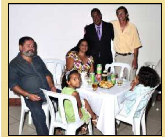
Com os amigos da Casa do Artesanato Artes e Vivência