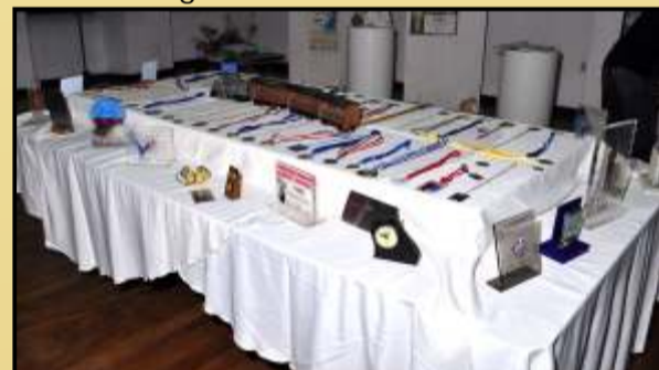
Uma vida de muito sucesso, repleta de premiações