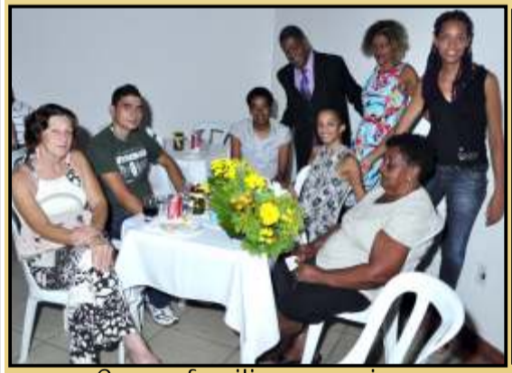
Com os familiares e amigos